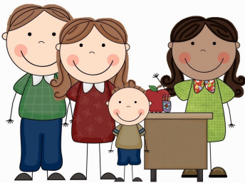
Conocer la Maestro