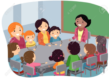
Asiste a los eventos escolares