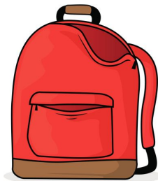
Revisar su mochila todos los días