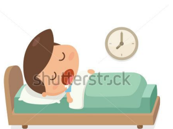
Buena noche de sueño